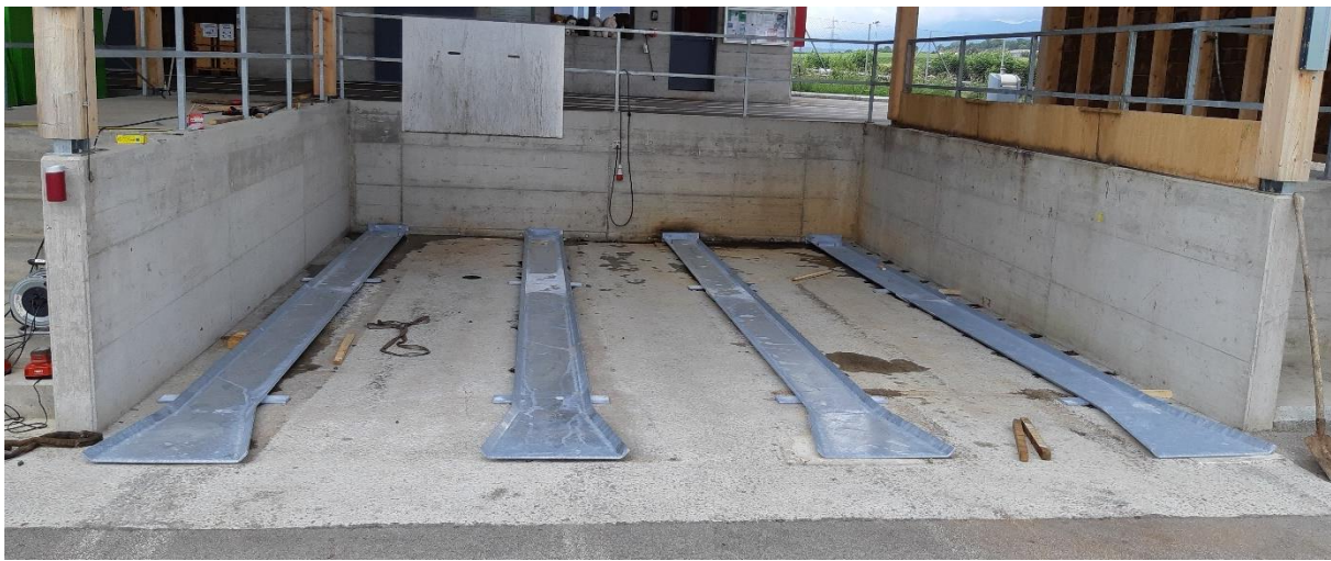
Figure 1 - Rails de guidage en acier posé en 2020 pour les bennes de verre et plastique

Une partie du problème est résolu par le changement des rails mais il demeure la problématique des points d'ancrage.