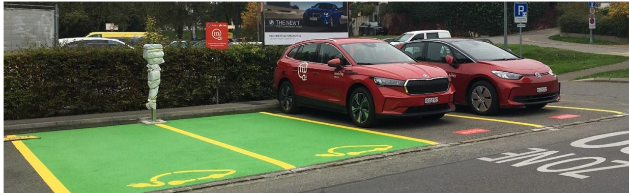
BORNES POUR VOITURES ELECTRIQUES ET VEHICULES MOBILITY