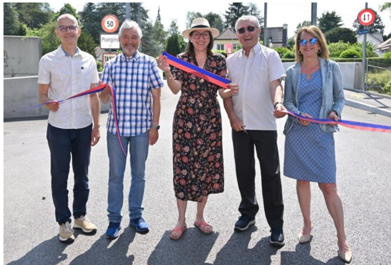
INAUGURATION PONT DE LA REDOUTE