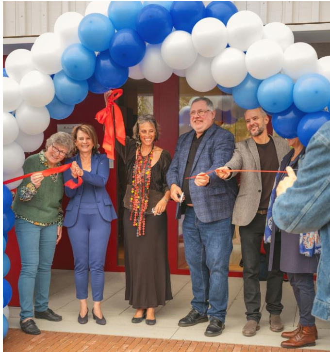
CRECHE ET CANTINE SCOLAIRE

Soutenir les échanges et développer les équipements favorisant un « vivre ensemble » harmonieux (familles, aînés, jeunesse), dynamiser notre politique culturelle et soutenir les activités sportives et la richesse du tissu associatif local