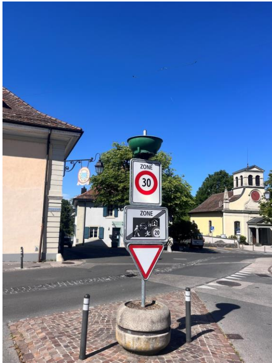
ZONES A VITESSE MODEREES SUR L'ENSEMBLE DU TERRITOIRE

Accompagner la croissance de mesures ambitieuses en faveur de la mobilité douce et de l'environnement de concert avec les communes voisines