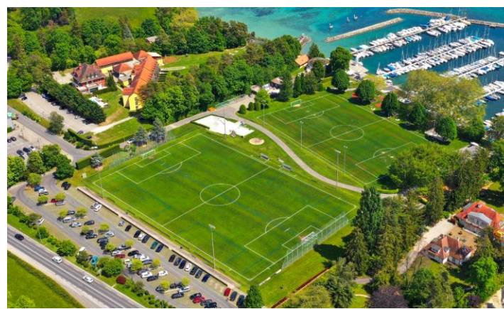
TERRAIN DE FOOT SYNTHETIQUE