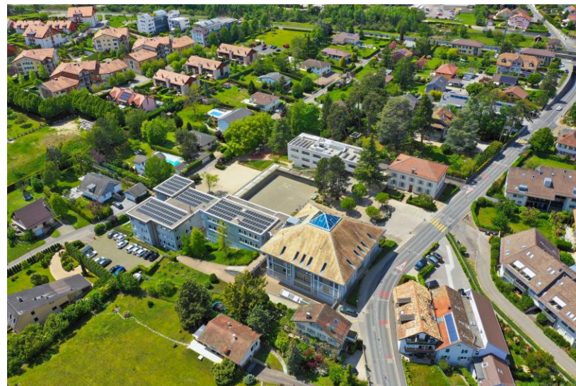
SUBVENTIONS POUR LES PROJETS PRIVES EN FAVEUR DU CLIMAT