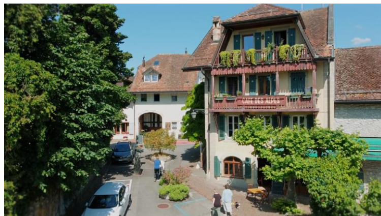
PERENISER L'ACTIVITE DU CAFE DES ALPES