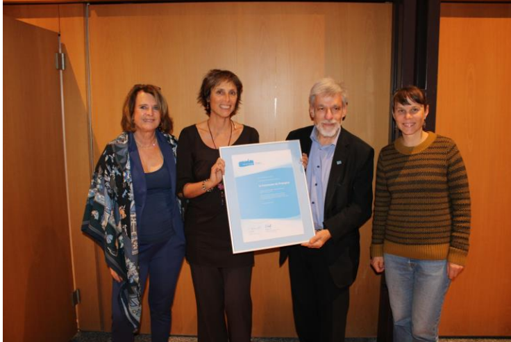
RENOUVELLEMENT DU LABEL CITE DE L'ENERGIE

Appliquer une action responsable face aux défis climatiques afin de diminuer les émissions de CO2 sur notre territoire, de s'adapter aux effets du changement climatique et de promouvoir la transition énergétique