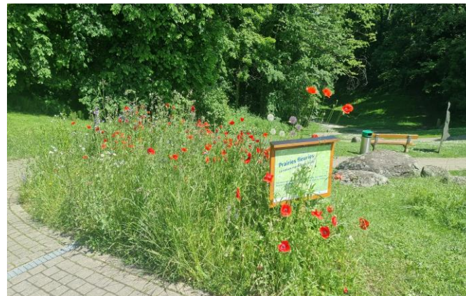
GESTION DIFFERENCIEE DES ESPACES VERTS