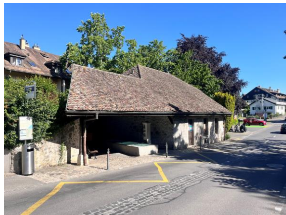
CENTRE D'ANIMATION JEUNESSE