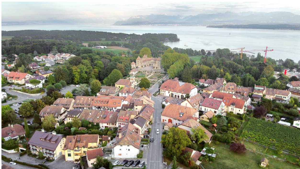
PLAN D'AFFECTION COMMUNAL (PACom) ADOPTE

Développer la commune avec équilibre en préservant la qualité de notre cadre de vie et de notre identité villageoise, privilégier un centre du village animé avec cafés, commerces et services, maintenir les entreprises sur notre territoire et favoriser les circuits courts