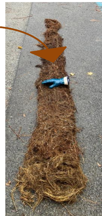
Queue de renard