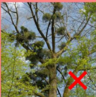
Boules de gui