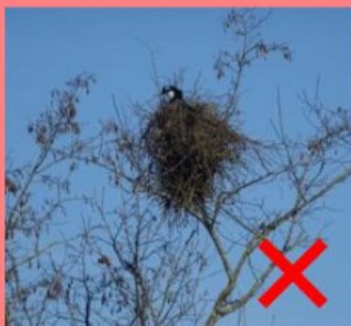
Nid de pie