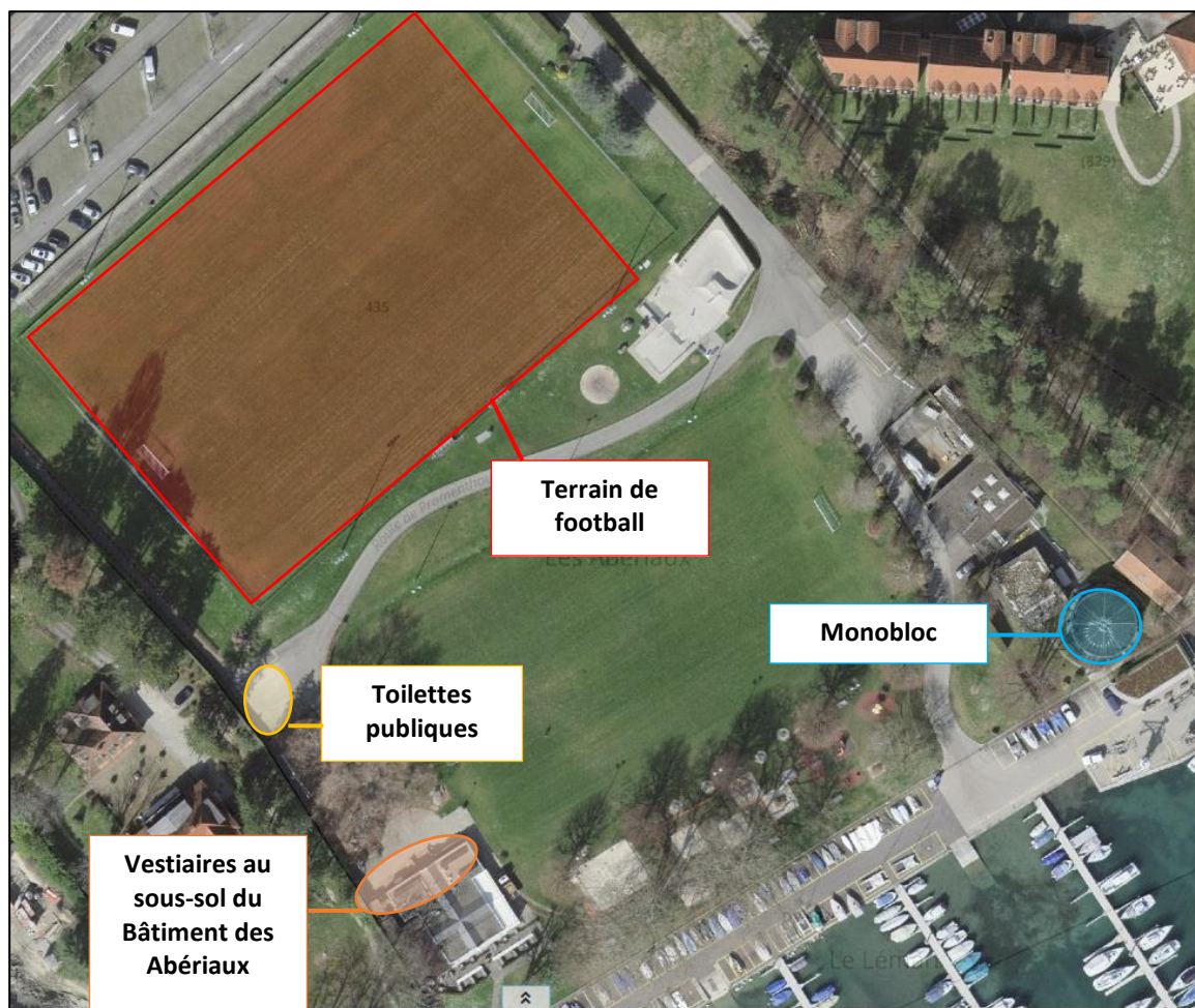
Figure 2 – Emplacement des projets de la Municipalité pour la législature 2021-2026 du site Les Abériaux