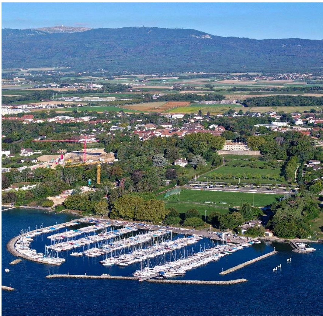
Fig.1 - Photo aérienne du site des Abériaux

Un des objectifs du programme de législature 2021-2026 de la Municipalité est de « bien vivre ensemble ». Il s'agit notamment d'adapter les infrastructures de loisirs et sportives aux besoins des utilisateurs. La zone des Abériaux est très prisée, autant par les pranginois que par les habitants de la région. Cet espace de vie collective manque toutefois cruellement de sanitaires adaptés à sa fréquentation très élevée. Le présent préavis vise donc à formuler une demande de crédit pour la réalisation de sanisettes ou WC publics, afin d'assurer un service de qualité pour les pranginois et visiteurs de la région.