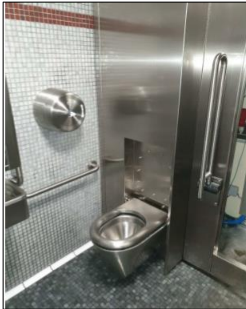
Fig. 4 – Intérieur de sanisettes, finition faïence.

A l'intérieur plusieurs revêtements sont possibles, inox, carrelage, peinture, ou résine. La faïence est préconisée, comme c'est le cas au vieux Pressoir.