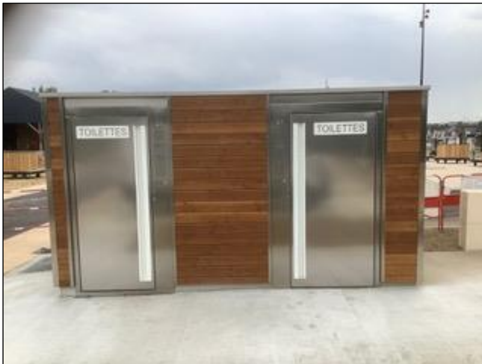
Fig. 5 - Façade extérieure des sanisettes, bardage bois

A l'extérieur, plusieurs finitions sont envisageables : l'inox, le bois, la pose de peinture anti-graffiti, la végétalisation ou le verre. Le bois est préconisé pour l'intégration dans le site.