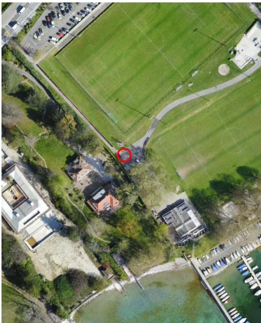
Fig. 2 - Photo aérienne montrant l'emplacement des sanisettes

Pour remédier à ces difficultés, il est proposé de créer un second espace de sanisettes. Cette solution pérenne permettra d'assurer une meilleure répartition des flux d'usagers et de promeneurs sur l'ensemble du site. L'implantation retenue pour la pose des sanisettes se trouve côté Genève du site des Abériaux, entre les deux terrains de football, en limite de propriété.