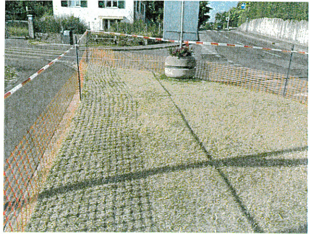
Parking des Fossés