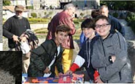
Le traditionnel marché aux puces des enfants.

50000 bougies ont été allumées par 660 volontaires sous la direction de l'artiste Muma. 80 bénévoles de l'Union des Sociétés Locales de Prangins et ses sociétés membres ont effectué 111 missions, soit des tranches de 2 à 3h de travail, pour que la fête soit belle. 1200 gobelets à vin environ ont été distribués 1200 bières ont été vendues ou offertes. 9000 visiteurs environ ont passé par Prangins durant le week-end, plus de 4000 samedi, 4600 dimanche.