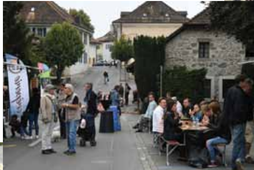
La Fête au village a largement débordé de la place cette année.