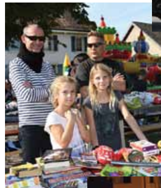
Des animations étaient proposées aux enfants le samedi après-midi.