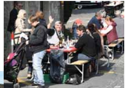
Ambiance conviviale dans les rues.