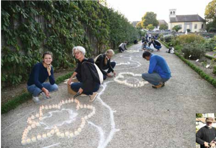
Les volontaires s'activent dans les jardins du château.

ANNIVERSAIRE – Prangins a pris des airs de festival les 29 et 30 septembre pour les 20 ans du siège romand de l'institution. Samedi, la Fête au village, concoctée par l'Union des Sociétés Locales et la Commune, a mis les bouchées doubles pour accueillir les visiteurs venus en nombre assister au spectacle «Fleurs de feu».