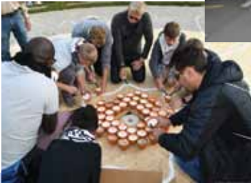
Les groupes allument les bougies selon les consignes de l'artiste Muma.