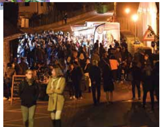
Les visiteurs se pressent devant les nombreux food-trucks.