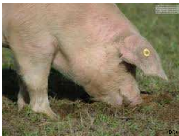
Responsables, mais pas coupables.