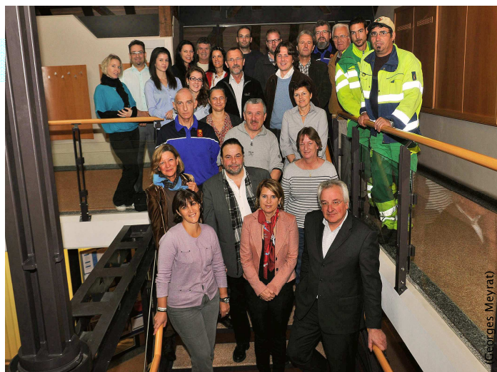
La Municipalité et le personnel communal.

JOYEUSES FÊTES DE FIN D'ANNÉE ET UNE BONNE ET HEUREUSE ANNÉE 2012 !