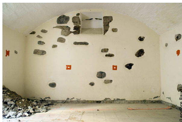
Carnotzet de l'auberge mis en dépression.

taculaire» de désamiantage. Le chantier a été totalement interdit à toute personne hormis les ouvriers qui travaillaient dans des combinaisons spéciales, avec masque de protection contre les particules fines. Un travail minutieux et éprouvant qui nécessite des pauses toutes les 2 à 3 heures, pour un maximum de 6 heures de travail par jour. Les locaux à traiter sont mis en dépression afin d'éviter que la