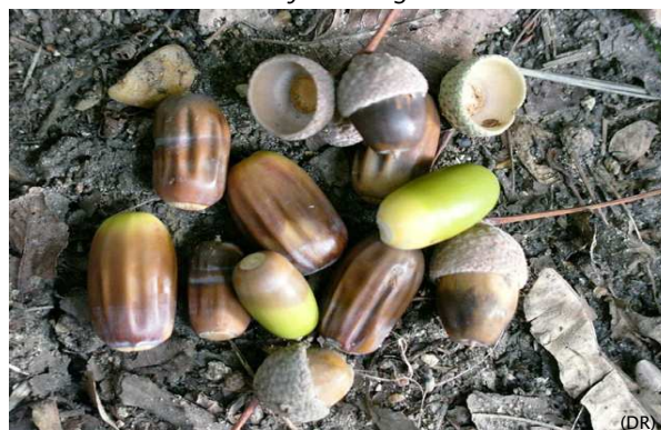
L'objet du litige.

Ayant été rapporté que plusieurs particuliers avaient mis leurs cochons aux bois de la Commune pour le pâturage des glands et cela à l'instigation du Petit Gouverneur lui-même qui y a amené les siens et en a averti une partie du village seulement, et cela sans permission ni ordre du Conseil, que d'ailleurs deux membres du Conseil encore y ont fait mener leurs cochons, le Conseil, après délibération a décidé que les membres du Conseil ayant manqué essentiellement peuvent être les seuls répréhensibles parce qu'ils doivent toujours donner bon exemple, en conséquence a imposé une amende de vingt batz au