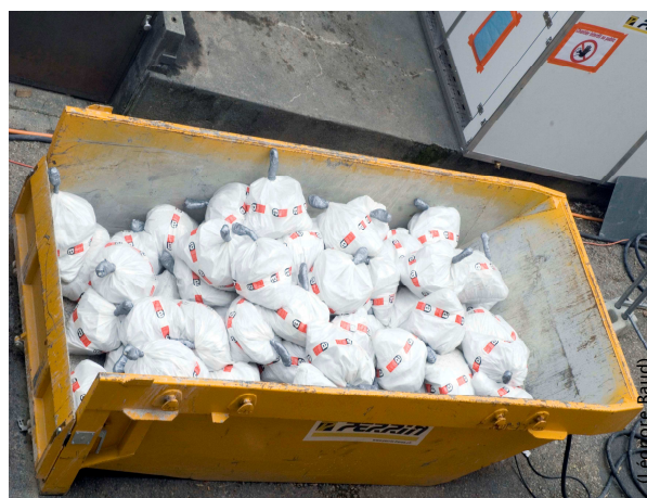
Les déchets d'amiante sont emballés dans des sacs spéciaux.

Une fois les matériaux amiantés collectés, ils sont mis dans des sacs spéciaux et envoyés par l'entreprise de désamiantage dans une décharge spécialisée. Dans le cas des déchets de l'auberge, l'archi-