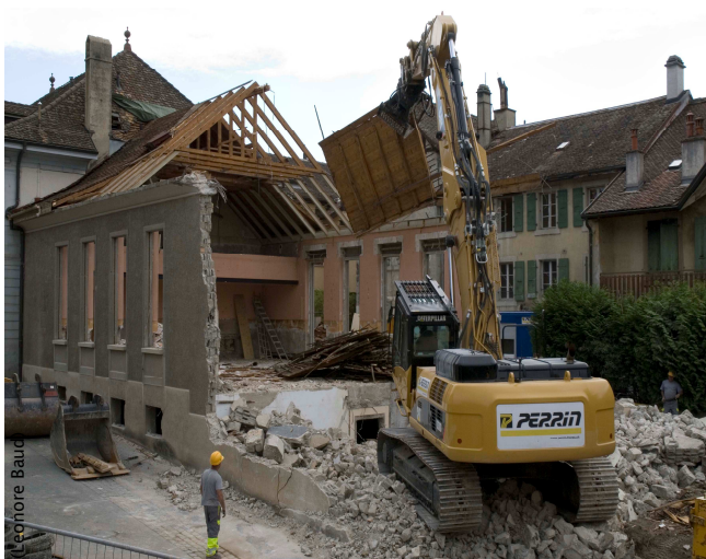
Démolition de l'ancienne salle.

Les fibres d'amiante peuvent constituer un risque pour la santé. Pour limiter ce risque, la Confédération a édité la directive CFST «Amiante» (directive 6503, édition 2008) et a modifié l'Ordonnance OTConst (RS 832.311.141) le 1 er janvier 2009, afin de mieux protéger les travailleurs des effets de l'amiante. Le Canton de Vaud a décidé de renforcer cette directive fédérale avec l'introduction d'un article spécifique dans la loi du 4 décembre 1985 sur l'aménagement du territoire et les constructions (LATC). Cet article (103 a Diagnostic amiante) a été accepté par le Grand Conseil vaudois le 18 mai 2010. Conséquences : depuis le 1 er mars 2011 , tout propriétaire qui entreprend des travaux de transformation ou de démolition soumis à autorisation sur un immeuble construit avant 1991 doit procéder à un diagnostic amiante de son bâtiment et prévoir un programme d'assainissement, le cas échéant (voir Gazette no 26, été 2011).