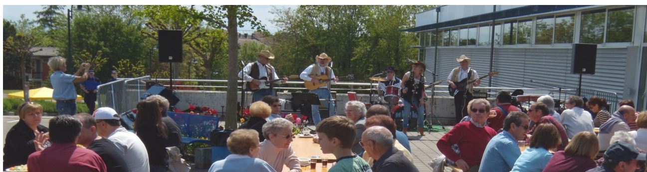
NEW COUNTRY RAIN – le repas a été pris au son de leur belle musique