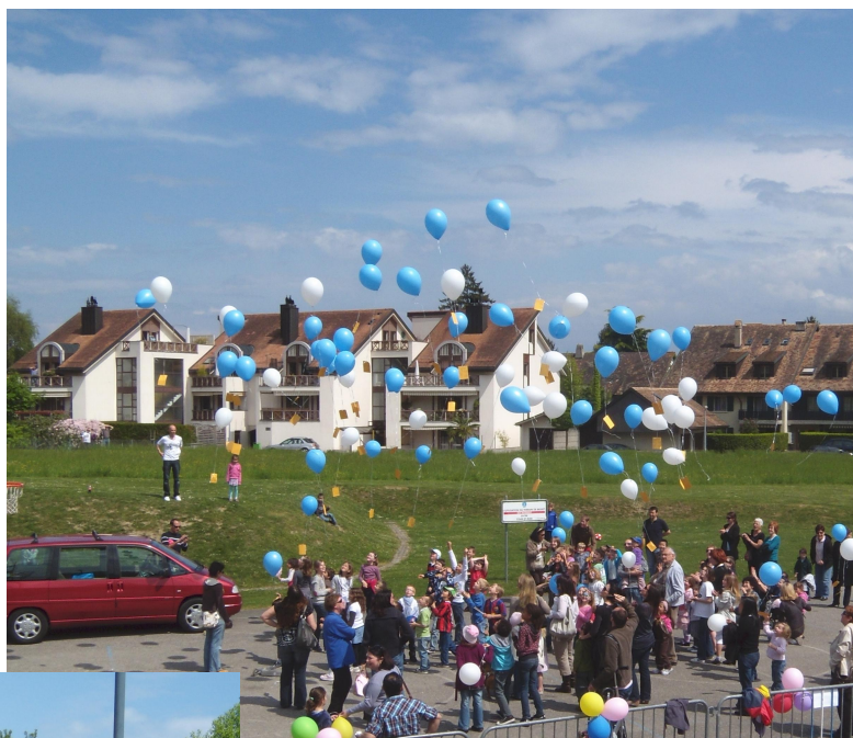
Magnifique lâcher de ballons