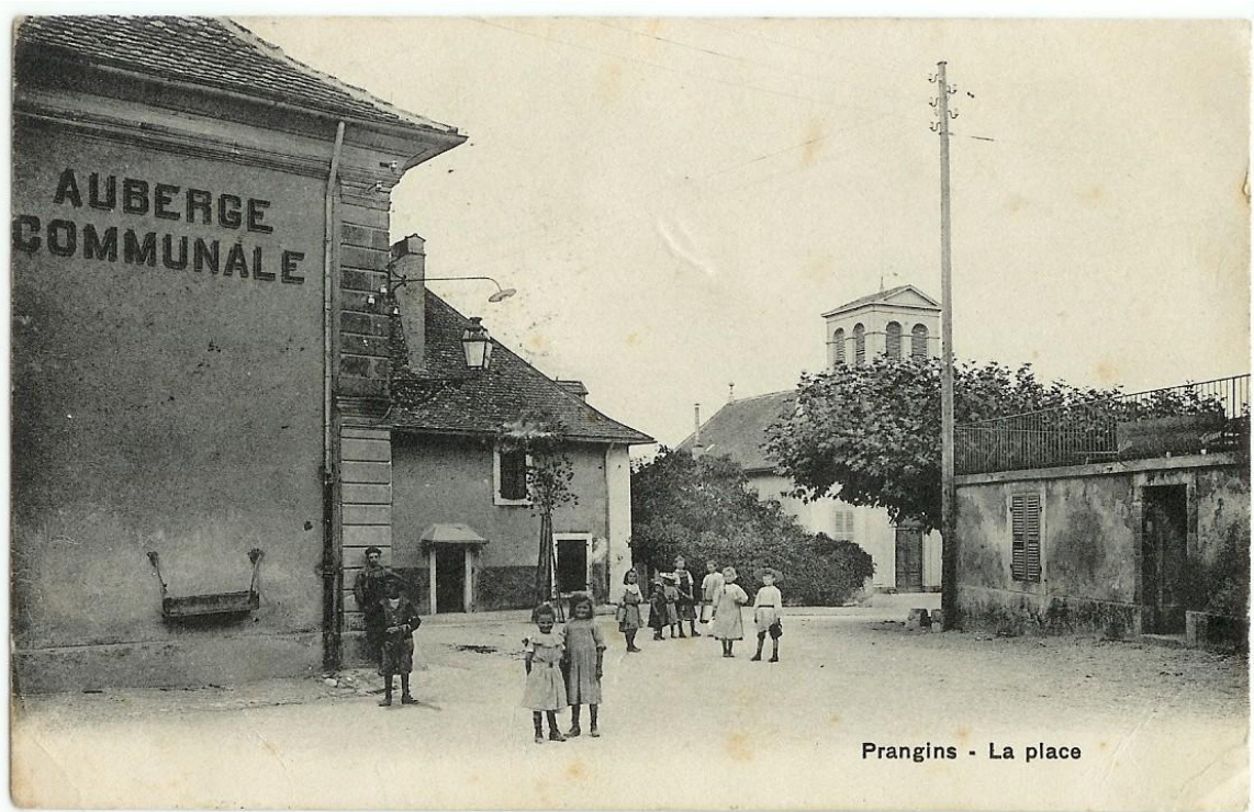
Prangins - La place